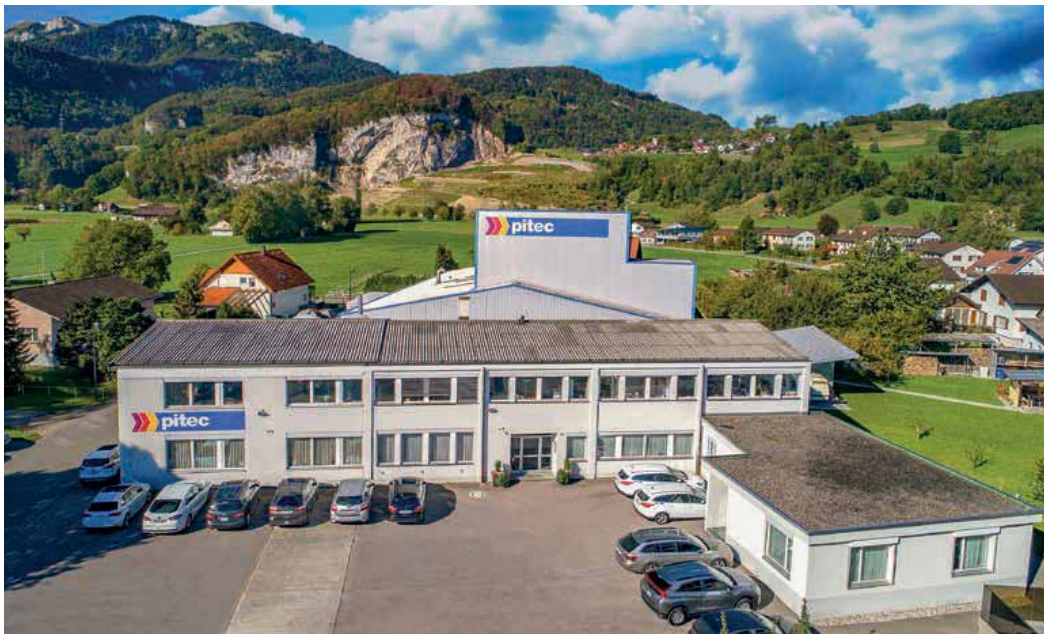
Pitec Hauptsitz in Oberriet SG mit weiteren Standorten in Rüthi SG, Gränichen, Villars-Ste-Croix und neu in Buchs AG.