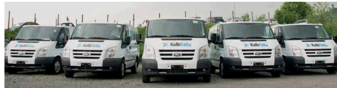
Das Kolb Kälte Servicetechniker-Team wächst durch den Erwerb der Aktiven der A+E Bäckereikälte AG auf 21 Kälte Servicetechniker. Das Pitec Servicetechniker-Team, bestehend aus Bäckerei- und Kältespezialisten, wächst somit auf insgesamt 58 Servicetechniker.